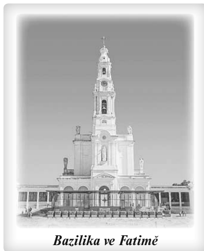
Bazilika ve Fatimě

Smiření a útěchu mohl působit také mimořádný život modlitby, k němuž patřila v první řadě účast na bohoslužbách ve farnosti, i když obě mladší příbuzné nebyly dostatečně staré, aby mohly přijímat. Už brzy se stále modlili všechny ty modlitby, které je naučil anděl a Naše Milá Paní, spojovali je se svými oběťmi. K nim patřilo to, co jim Maria řekla v červenci: „Modlete se, modlete se mnoho a přinášejte oběti za hříšníky, vždyť mnoho duší přichází do pekla, protože nikdo se za ně nemodlí a neobětuje... Když přinášíte oběť, říkejte: »Ježíši, dělám to z lásky k tobě, za obrácení hříšníků a ke smiření za všechny ty hříchy...«“ Ale nejkrásnější z těchto modliteb je vždycky velká modlitba klanění anděla Eucharistie, zaměřená k oběti Syna Otcí v Duchu Svatém, obsahuje v sobě všechno, co může Boha potěšit a usmířit zlo. František se stal svým způsobem